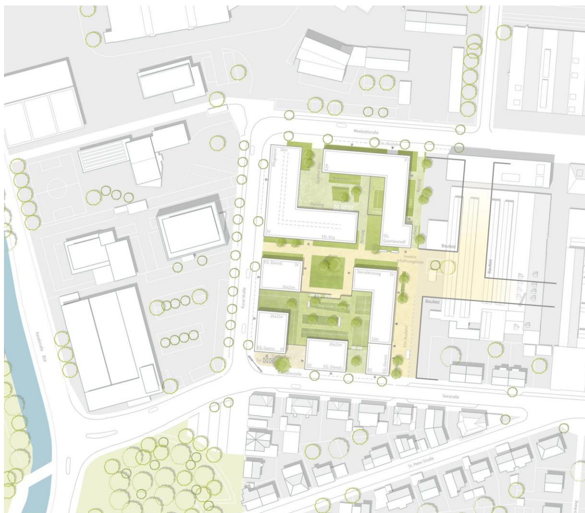
Städtebaulicher Entwurf ehemaliges Schlachthofareal

Der städtebauliche Entwurf zum ehemaligen Schlachthofareal konkretisiert das Leitbild „Wohnen im Heidenheimer Osten“ an der Schlüsselstelle zur Entwicklung des Brenzpark Quartiers. Der Entwurf ist aus der Abwägung verschiedener Varianten hervorgegangen und bringt die besonderen örtlichen Gegebenheiten mit den Entwicklungszielen in Einklang. (Siehe dazu im Anhang die Darstellungen „Entwurf Schlachthofareal“).