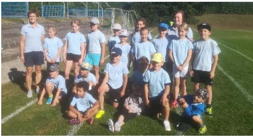
Die Abteilung Kinderturnen des Sportvereins Großkuchen besuchte das Gaukinderturnfest in Möglingen.