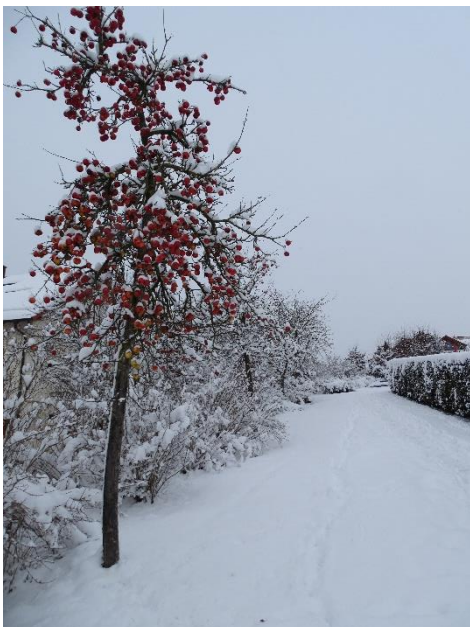
Winteräpfel – nicht nur am Alten Berg.