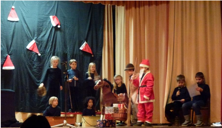
Weihnachtsfeier mit Musik, Herz und Gaunern aufgeführt von der Grundschule und dem Kindergarten.