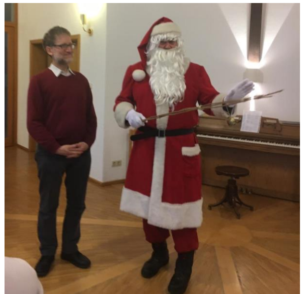
Der Nikolaus besuchte das Frauen-Frühstücksteam.