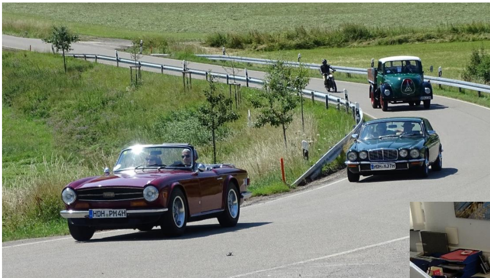
Die Teilnehmer des Oldtimer -Tages im Brenzpark kamen bei ihrer Rallye auch durch Klein- und Großkuchen.