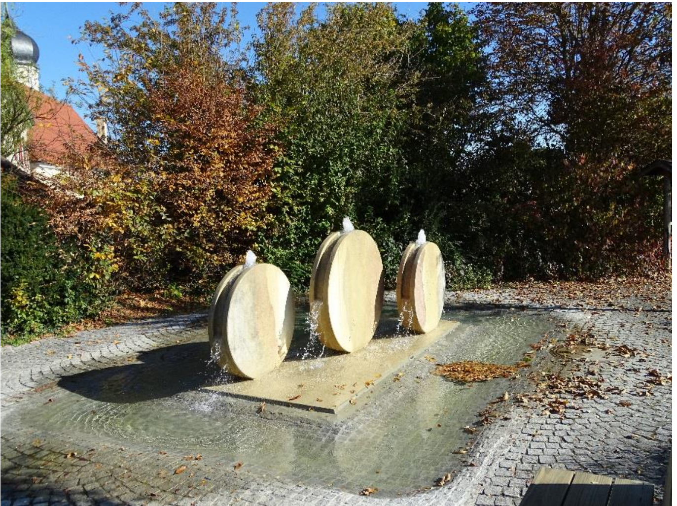
Brunnen im Herbstkleid