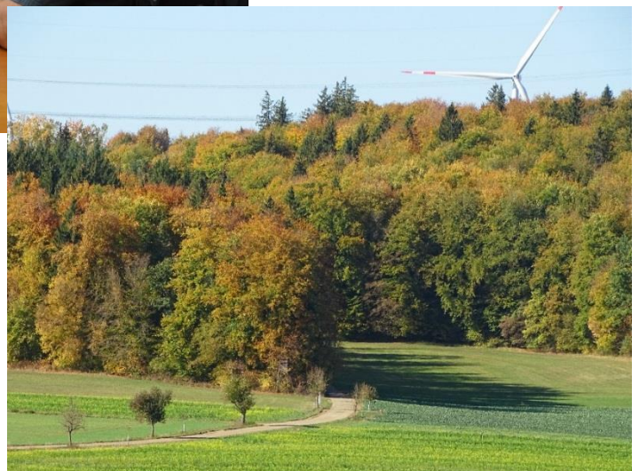
Herbstwald Richtung Nietheim