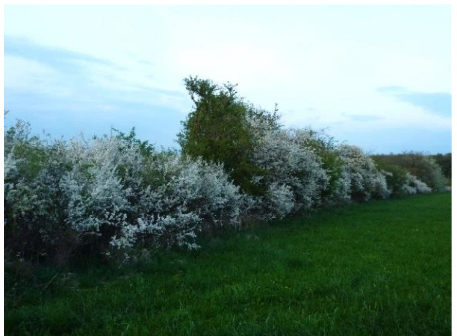
Schlehenhecke am Frühmeßhau