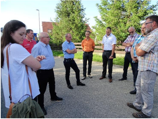
Bei einem Rundgang durch Großkuchen besichtigte der Ortschaftsrat verschiedene Projekte.