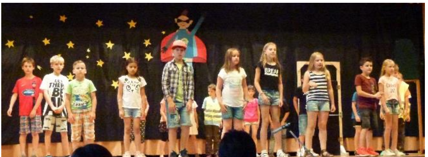
Das Musical „ Superheld ohne Taschengeld “ wurde von der Musical-AG geschrieben und aufgeführt.