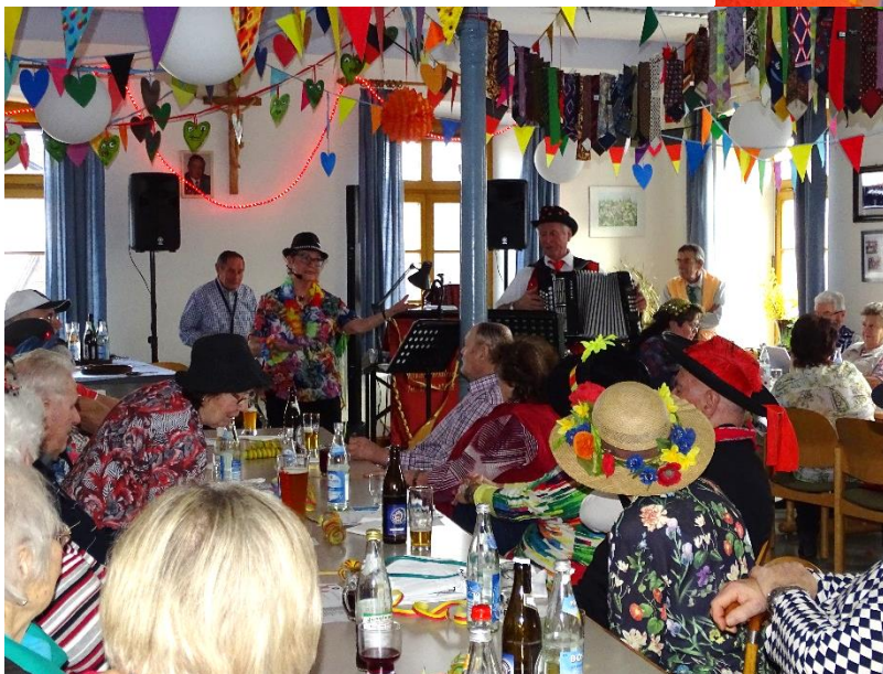
In der Schwabschule fand der Fasching des Rentner- und Seniorenclubs statt.