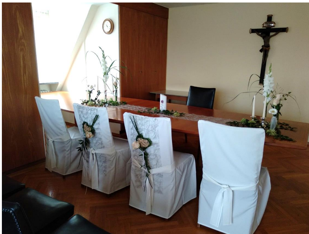
Im Sitzungssaal, welcher auch zum Trauzimmer umgestaltet wird, fanden vier Trauungen statt.