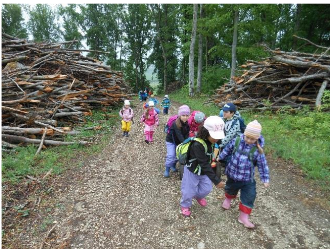
Der Kindergarten veranstaltete „ Waldtage “.

Eine neue Vogelnest-Schaukel wurde im Kindergarten aufgestellt.