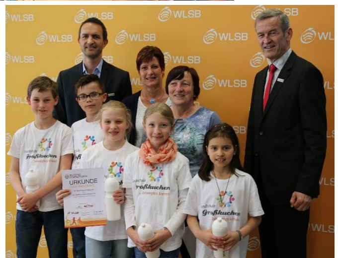
Ehrung der Grundschule Großkuchen durch den Württembergischen Landessportbund für ihre Platzierung beim Sportabzeichen-Wettbewerb.