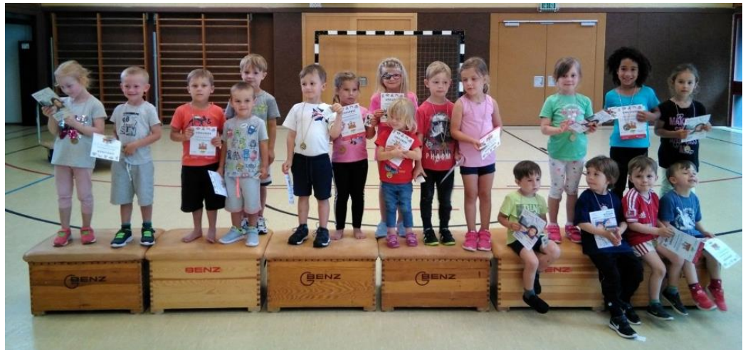
Viele Kinder des Kindergartens legten das Kindi-Sportabzeichen ab.