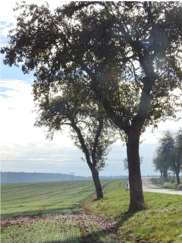
Streuobstbäume entlang der Straße nach Kleinkuchen