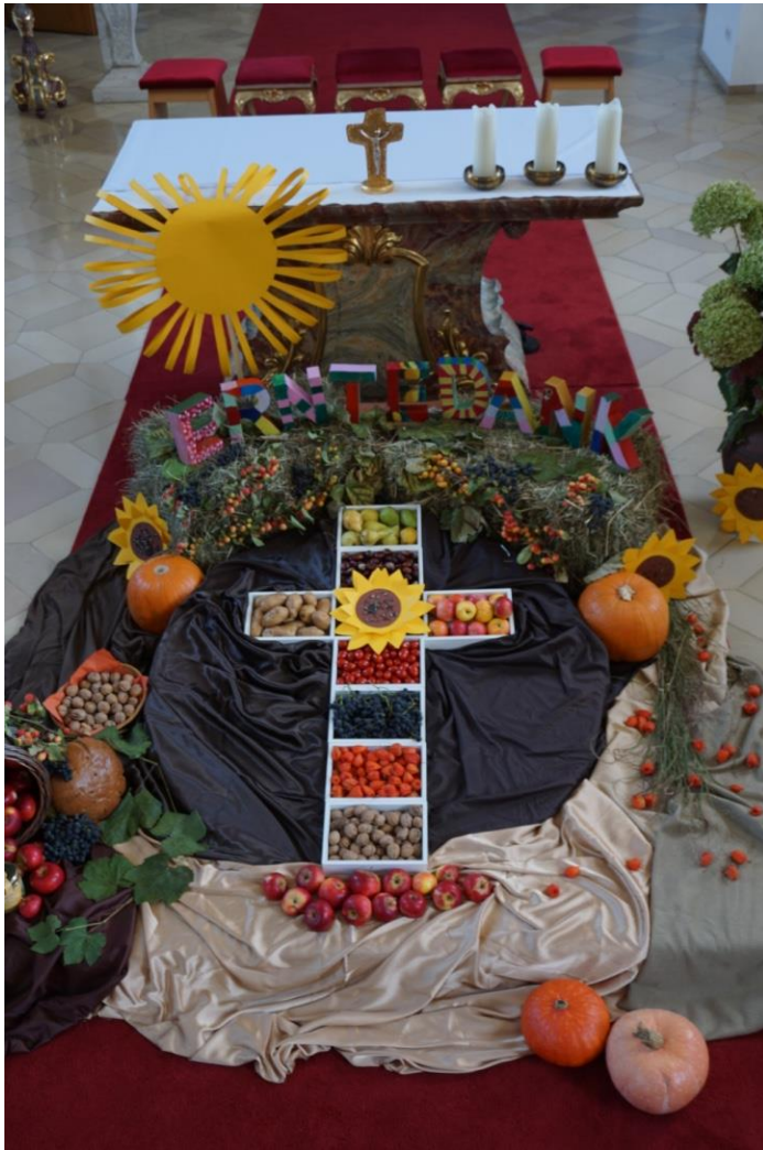
Erntedankaltar in der katholischen Sankt-Peter-und-Paul-Kirche