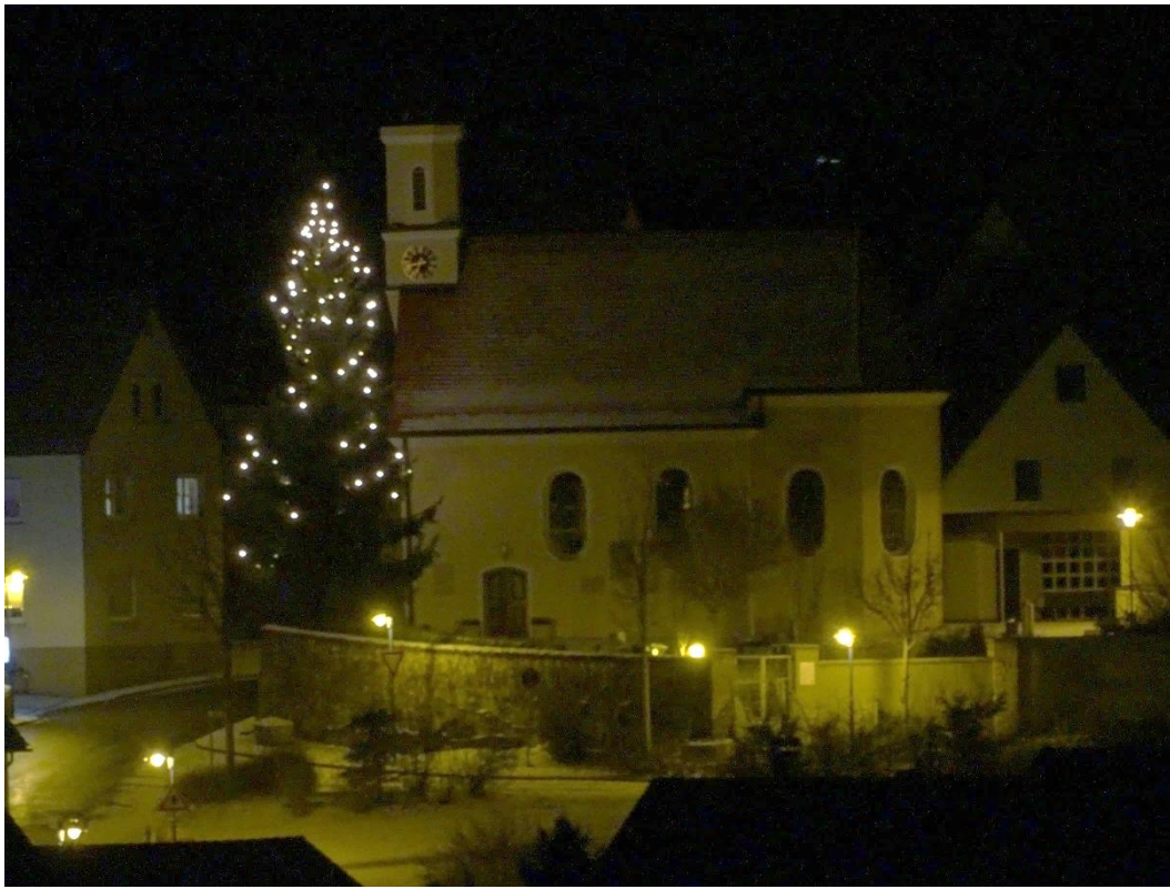
Weihnachtsbaum in Kleinkuchen

Der Musikverein Großkuchen stimmte am 24.12. an verschiedenen Plätzen die Einwohner der Gesamtortschaft mit weihnachtlichen Klängen auf das Fest ein.