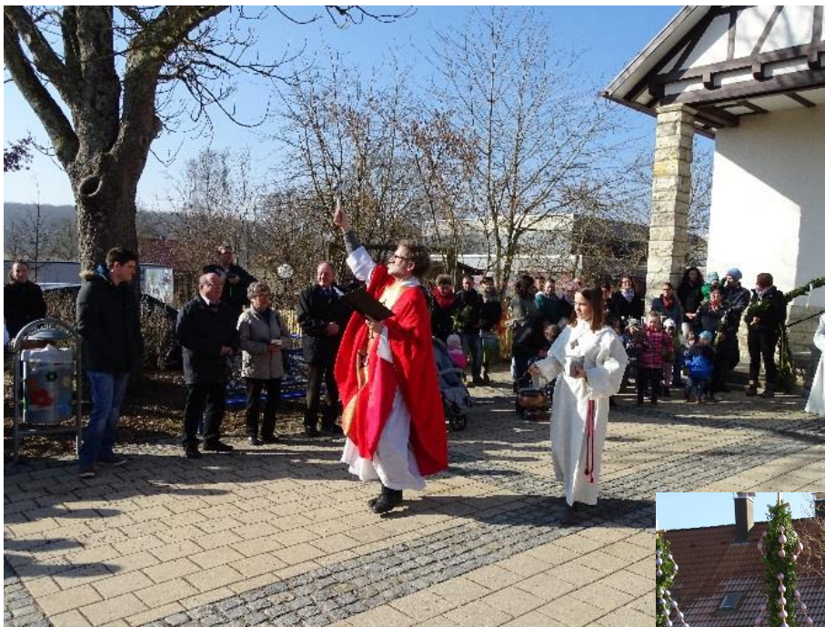
Palmweihe auf dem Rathausvorplatz, danach Prozession zur Kirche