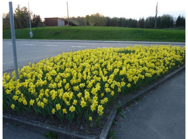
Blumenbeet in Rotensohl

Im Mai fanden bei der Franz-Josef-Kapelle in Nietheim und bei der Hirnhau-Kapelle in Großkuchen Freiluftgottesdienste und bei der Mariengrotte eine Andacht statt.